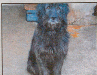
Gos d'atura macho, 8 años