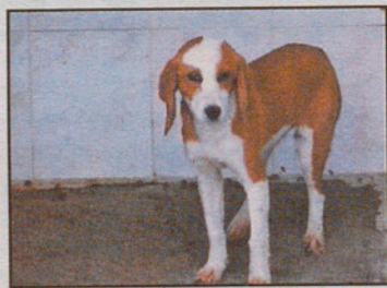
Cazadora hembra, 1 año