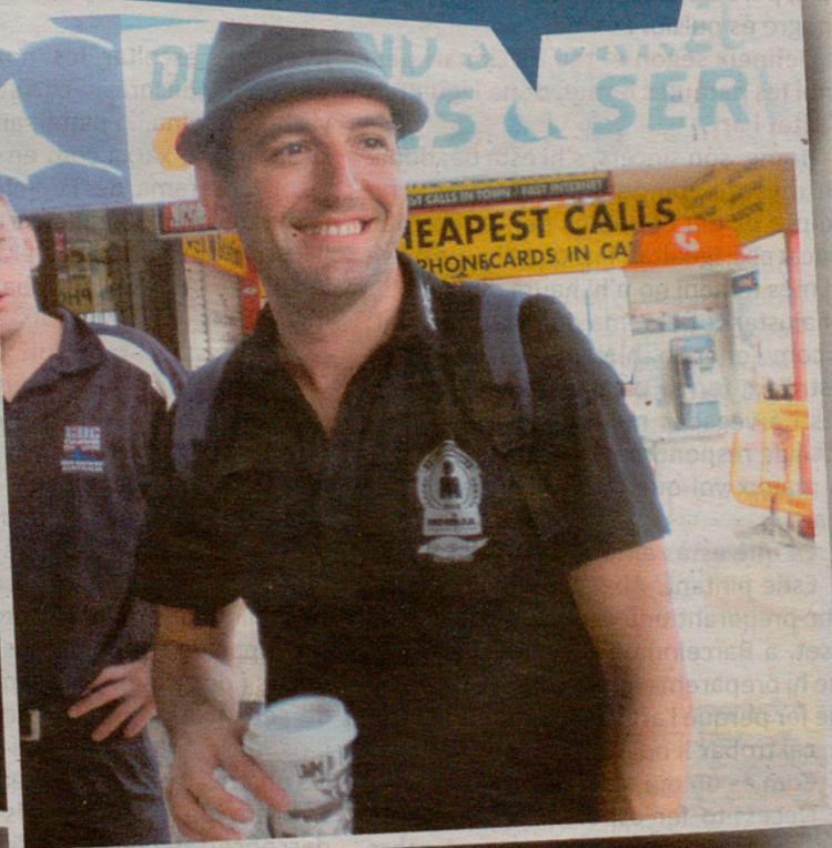
El Rafel en primer pla i unes espectaculars vistes de la ciutat!