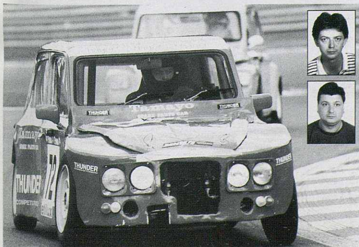
Els pilots de Bigues al circuit de Spa-Francorchamps

Motor 652 c.c., encès electrònic, alimentació: 2 weber 40 DCOE, règim màxim: 8000 rpm, suspensió original Citroën amb 2 barres estabilitzadores davant i una darrera, frens: discos davant i darrera, pneumàtics: 145/15, carrosseria: alumini i fibra de vidre.