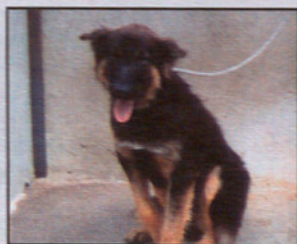
Pastor Alemán hembra 1 año