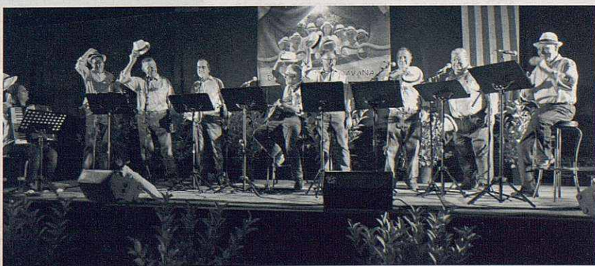
Cantada d'Havaneres al pati de Can Burgués.

El passat dia 13 de juliol varen fer la presentació en un concert on van convidar amics i familiars. La cantada va tenir lloc a l'espai privat de l'era de Can Burgués.