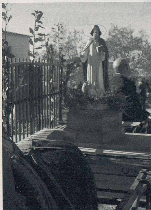
La imatge de Sant Antoni presidia la cercavila.