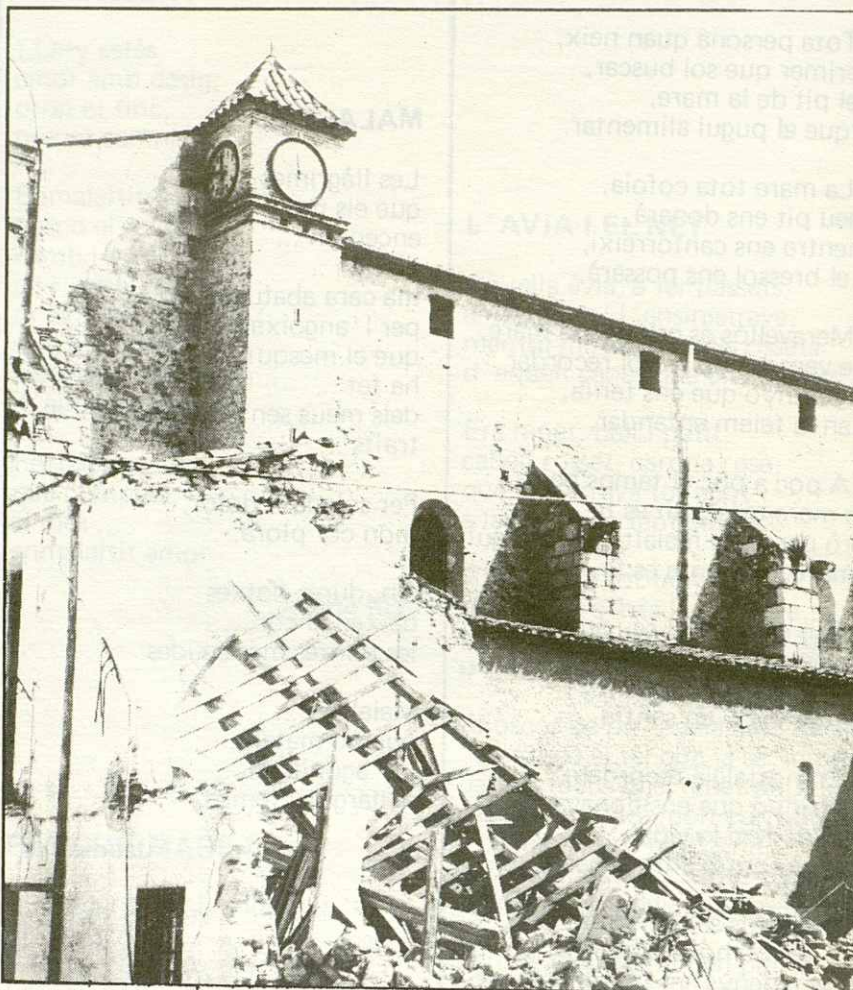
Amb l'enderroc de can Vidal, l'Església de La Roca va guanyar en vistositat; a banda les pedres de molí que varen aparèixer, testimoni d'un passat interessant.

El campanar descansa sobre el mur de la banda esquerra entre els dos primers contrafors.