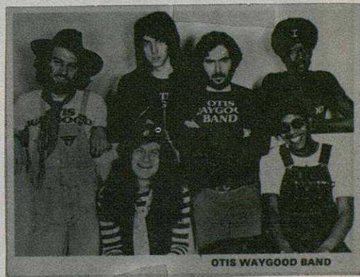
OTIS WAYGOOD BAND

Hacia mucho tiempo que la industria discográfica inglesa no recurría a esa fórmula que tan buenos resultados le dió a finales de los años sesenta, referente a los grupos mixtos, es decir, negros y blancos en una misma formación; recordemos: The Equal, The Foundation, etc.