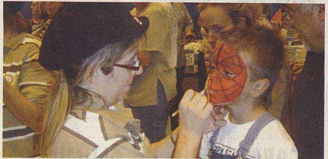
La panadería Gaba pensó en todo momento en los más jóvenes