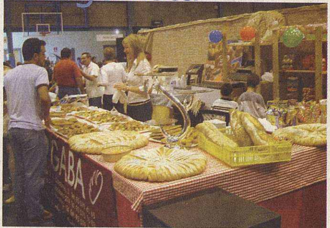
La panadería Gaba mostró sus exquisiteces

Con estas actividades, el Forn de Pa i Pastisseria Gaba quiso poner su granito de arena para lograr que la Mostra fuese un éxito, además de ofrecer a los visitantes de un divertimento extra. Sin duda, el Forn de Pà i Pastisseria Gaba que cumplió con el propósito de su promotor. ■