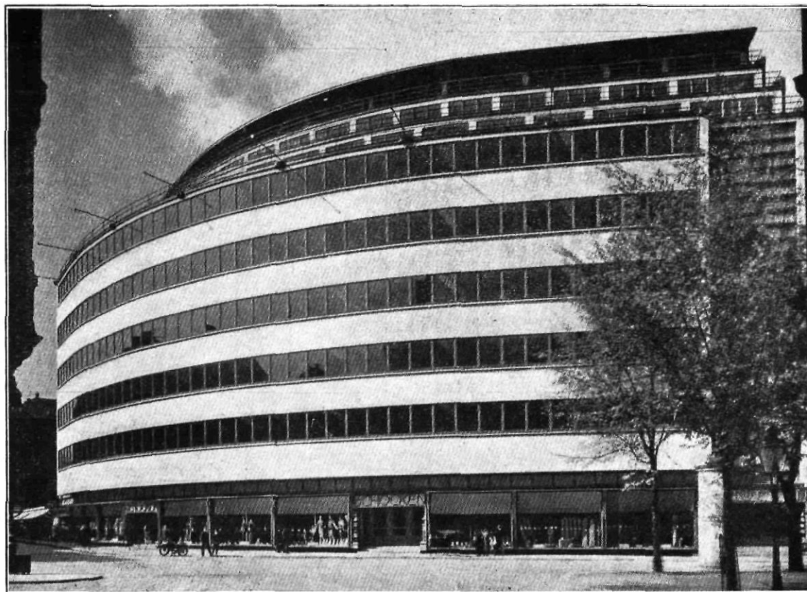
Magatzems Schocken, a Chemnitz : Vista de conjunt