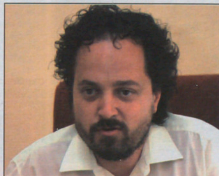
Joaquim Farriol, alcalde de Lliçà