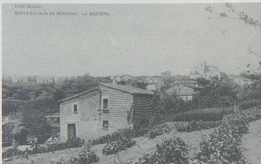
La Sagrera, als anys 20 del segle passat.

Del Rieral: can Falgà, can Feu, can Pallars, can Sampera, can Pou, can Carreter, el Molí, ca l'Espelt, can Maranges, el Casolot, can Bruno, can Corder, cala Pujala, can Tabaquet del Rieral, can Tic, can Pineda, can Paiagua, can Calderí, can Pep, can Pau, el parque, Can Sidro, can Llorens, la Bastida de Baix (o Nova), can Forner de Baix, can Joan Paiagua, la Tenda, can Francesc, can Bonet, les cases del Lluiset, can Joan Granada, can Poma, cala Elena, can Girbau, la Sala, can Barber, can Cladellas (o can Girbau), can Lampista, cala Maria Planxadora, can Fuster (o can Boter), cala Tresina, can Clot, can Lluís Bonet, can Mingo, can Duran del Rieral, can Manent, can Burgués, la Bastida de Dalt, la Ferreria, can Plantadeta, can Ribafort, can Careta, cal Àngel, can Farrerons, ca l'Arcís, la Casa Vella, can Brus-