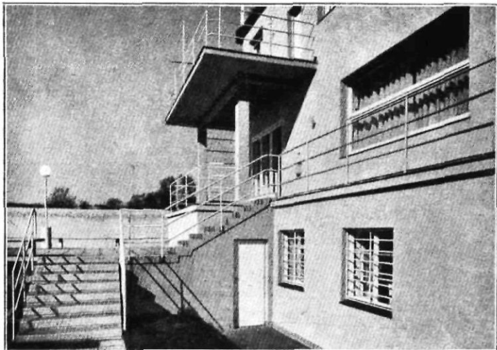
Casa particular a Viena : Escala del jardí