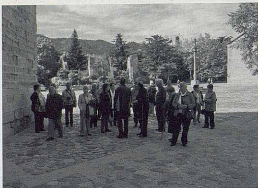
Visita al Monestir de Poblet.

A l'abril vam anar a visitar el Monestir Cistercenc de Poblet, datat del segle XII. És panteó dels Reis de la Corona d'Aragó i museu arxiu de Poblet Tarradellas. Les 36 persones que van venir per visitar-lo es van submergir en un conjunt monumental de formes, tradicions i de símbols. Després de fruitar de l'espectacle de la pedra i la llum tots es van preguntar quina institució, i amb quines vicissituds, va anar produint aquesta enorme realitat artística i històrica.