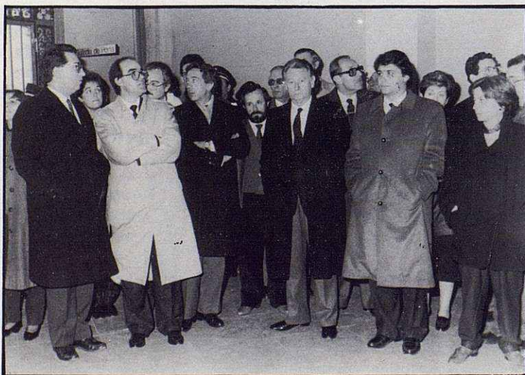
Representaciones de todos los estamentos sociales estuvieron en el entierro, especialmente las de carácter deportivo. En la fotografía, vemos a los señores Vallverdú, vicepresidente de la Diputación Provincial; Pujadas, alcalde de Granollers; Vilaseca, director general de Deportes de la Generalitat; Montal, diputado al Parlamento de Catalunya; entre otras personalidades.