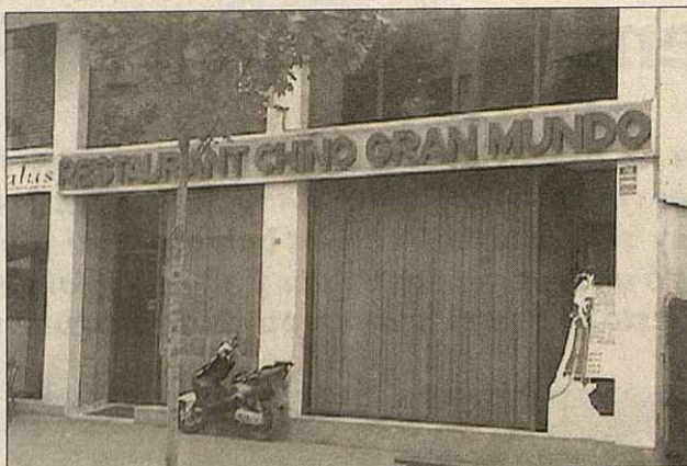
Mollet cuenta con siete restaurantes chinos

María , sin embargo, reconoce que hay alguna oferta en la carta que pertenece más a la cocina es-