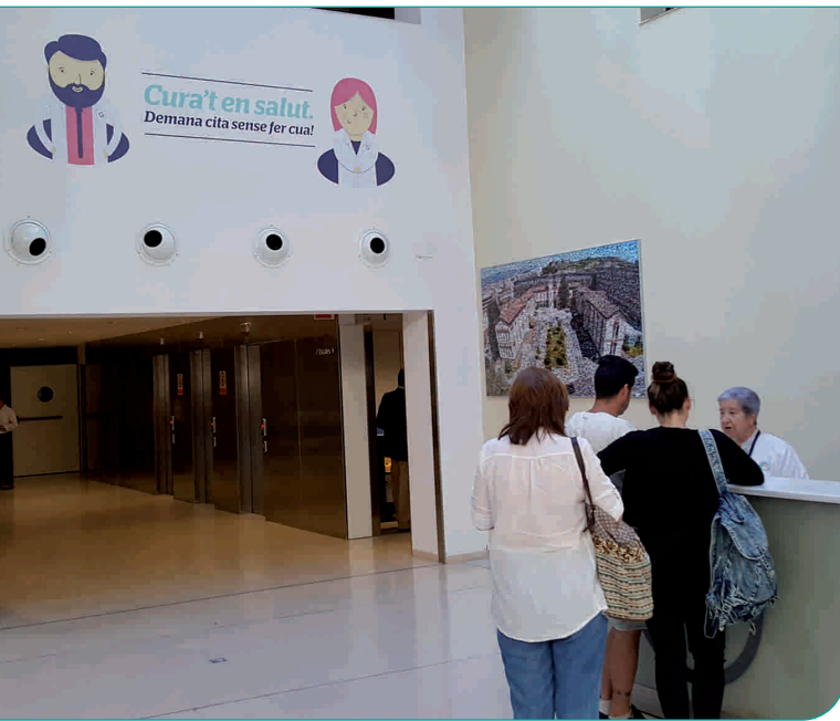
Rètol informatiu de la campanya situat al vestíbul de consultes externes

El passat mes de juny, l'Hospital General de Granollers va posar en marxa un nou sistema de sol·licitud de visites per a les persones usuàries del centre. Aquest nou sistema té com a objectiu agilitzar el tràmit administratiu de citació de visites successives i que no sigui necessari passar pels taulells d'atenció ambulatoria i proves, fet que sovint comporta haver de fer una cua.