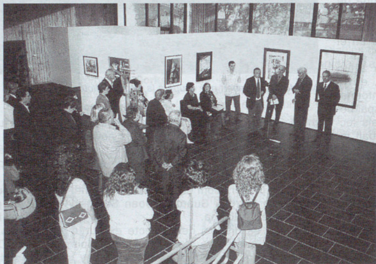
Donació de l'obra d'Albert Ràfols Casamada al Museu i vista general de l'exposició.