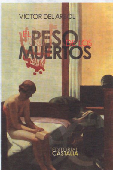
Victor del Árbol.