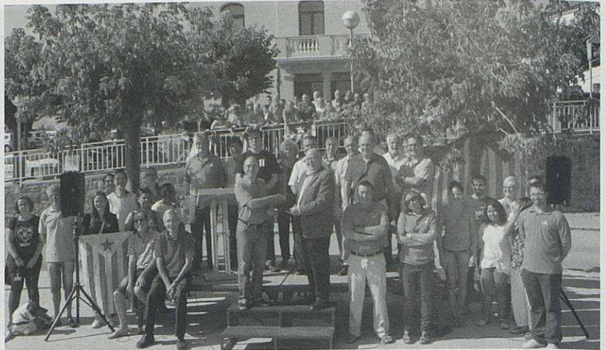
Els representants de les entitats lliurant a l'Alcalde els compromisos signats.

A la tarda va arribar l'hora d'omplir els cinc autobusos que havia dispostat l'ERA-ANC per participar a la gran "V". Amb gran puntualitat i disciplina els santaeulaliencs ens vam sumar als prop de dos milions de catalans que varen omplir la Gran Via de les Corts Catalanes i la Diagonal de Barcelona per formar una senyera de gegantines proporcions en forma de "V". Amb aquesta "V" es va voler significar a tot el món la nostra voluntat de votar per decidir democràticament el futur polític del nostre país. Un any més la immensa mobilització va exhibir un comportament exemplar, fent del civisme, del pacifisme, de la transversalitat social i política i de l'actitud festiva els seus símbols distintius.