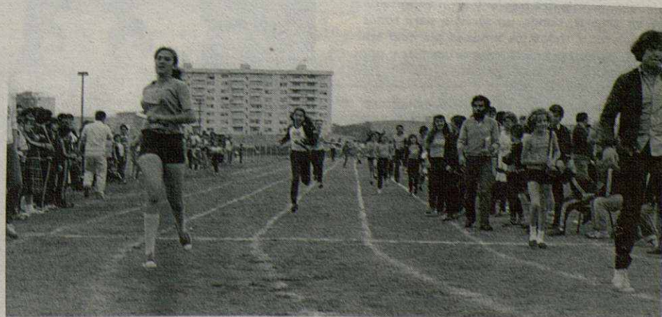
En el ejercicio anterior un total 1.600 escolares tomaron parte en los II Juegos Escolares. El objetivo para el presente curso es el de superar dicha cifra de participación.

—Esa es nuestra intención. Esperamos que al igual que entonces, en que las previsiones se desfazaron, la asistencia sea masiva. La finalidad de esta campaña es la realización de deporte de mantenimiento más que de perfección.