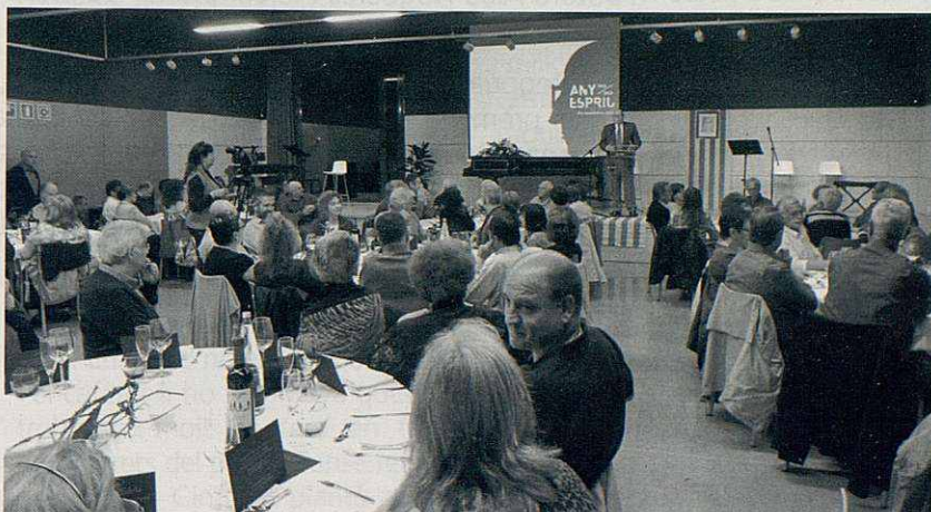
El sopar literari va omplir l'auditori de la Biblioteca.