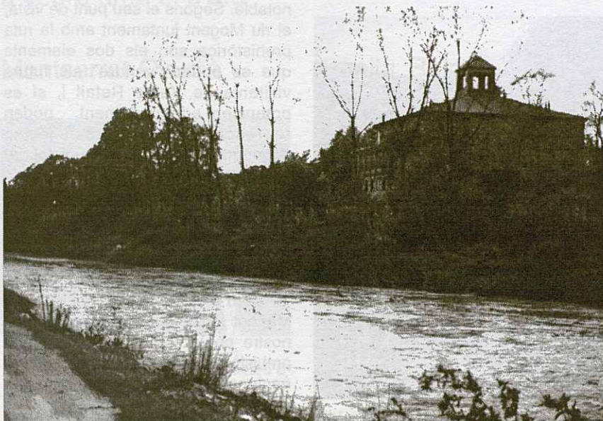
Aiguats a la Roca el novembre de 1988.

vernedes i omedes que provoquen l'existència d'ocells com el brenat pescaire i l'agró roig, el blauet, els ànecs, el balquer i l'àguila marcenca. En alguns punts molt concrets d'aquesta zona, concretament on l'aigua és ben neta, també hi podem trobar algun cranc de riu, espècie poc present al llarg de tota la conca.