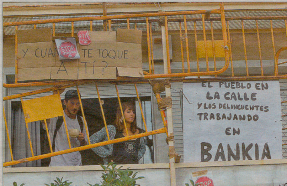
Miembros de la PAH protestan contra un desahucio.