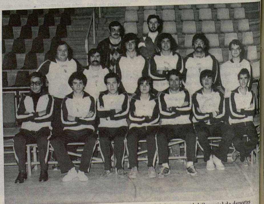
Monitores de la escuela deportiva, acompañados del director y del Concejal de deportes

La Escuela Deportiva, los Juegos Escolares y el Deporte de Mantenimiento para adultos, son tres grandes éxitos de esta entusiasta activa "Comissió d'Esports" de Santa Perpetua que nos gustaría ver plasmados en otras poblaciones de la comarca.