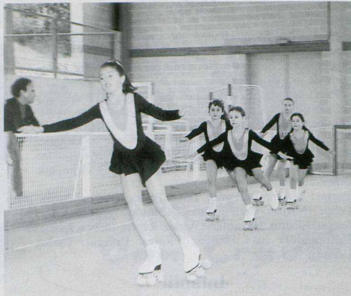
El patinatge a Bigues i Riells està força arrelat