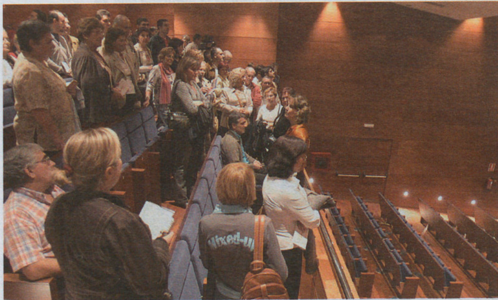
Can Palots, ha viscut un any de moltes emocions.