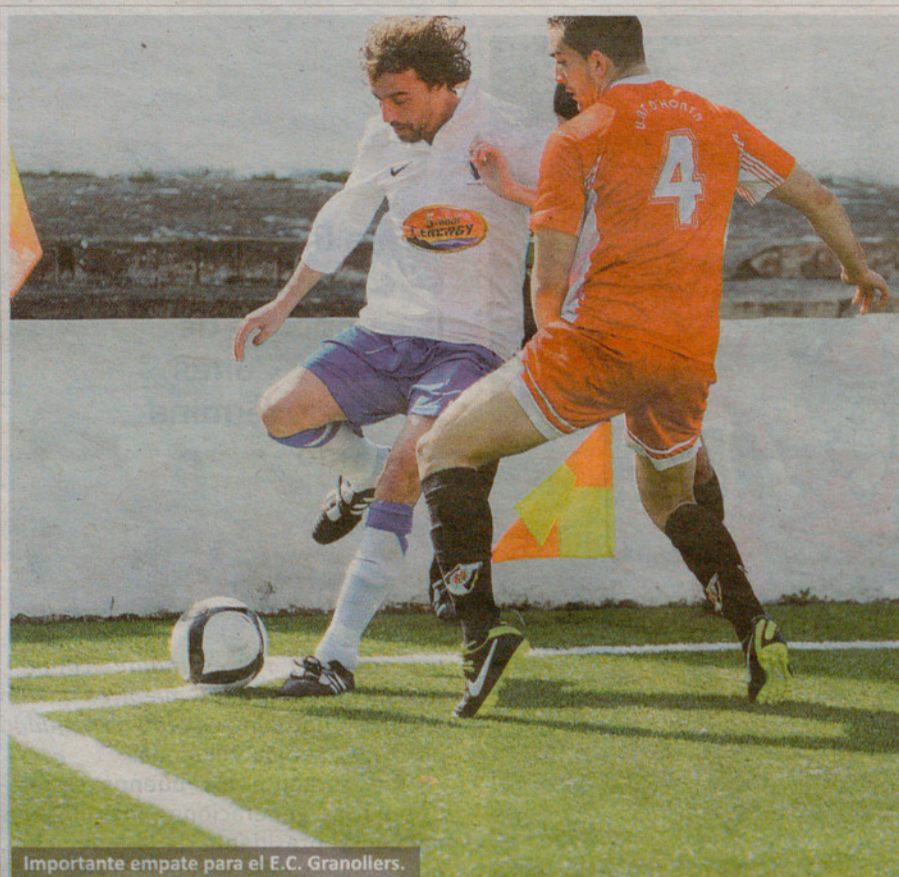
Importante empate para el E.C. Granollers.