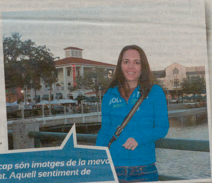
L'Angi a Celebration (Orlando)

El primer que em ve al cap són imatges de la meua ciutat amb la meua gent. Aquell sentiment de