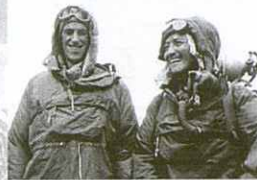
El neozelandès Edmund Hillary i el xerpa Tenzing Norgay van assolir els 8.848 metres del cim a les 11.30 h del 29 de maig del 1953