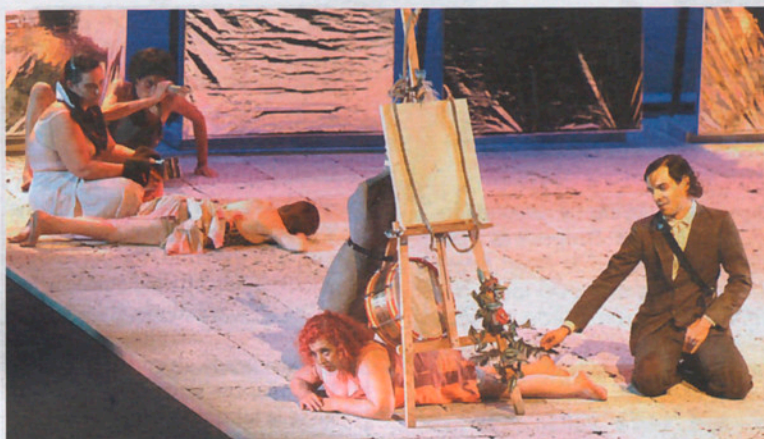
Un moment de l'espectacle "Fando y Lis", de la companyia El Tinglao