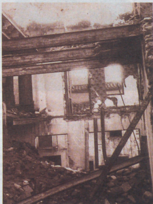
Can Carbó de la carretera, bombardejat el 31 de maig de 1938.

Aquells fets, 70 anys després, no es coneixen encara bé i alguns d'ells foren silenciats durant 40 anys per la dictadura. La recuperació de la democràcia està posant a prova una pàgina, la de la Guerra Civil, que mereix tota mena d'opinions sobre els que consideren que és una història passada; els que opinen que encara no s'ha fet justícia; o aquells altres que aposten per fer una revisió total i recuperar dignament la memòria. Més enllà de parlar ja de vençuts i vencedors, hi ha qui aposta per parlar de la guerra de tots i ser