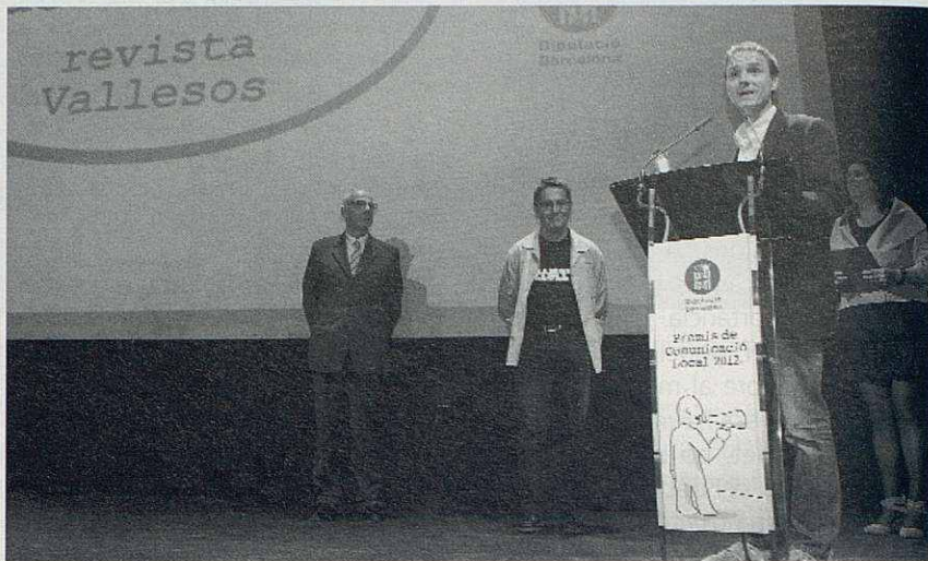
Acte de lliurament dels Premis de Comunicació 2012.

És evident que el guardó aconseguit representa per a Vallesos una enorme satisfacció i esdevé un reconeixement explícit a la feina que encapça-