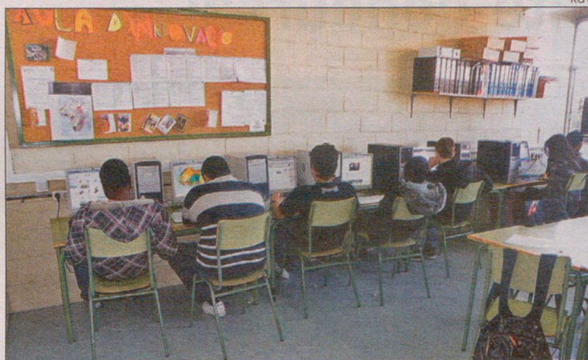
Los alumnos del Carles Vallbona durante una sesión práctica.