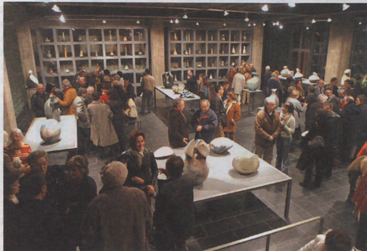
Les exposicions, una de les apostes del Museu.

La contextualització de les visites situa el Museu pel que fa al nombre de visites una mica per damunt de la mitjana de Catalunya amb 24.406 visites el 2005 (el Museu de Mollet enregistrà en el mateix període 7.578), xifres positives en relació al Museu Comarcal de Manresa, per exemple, però clara-