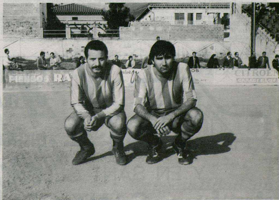
ESCALE y PEREZ, dos carreras paralelas. Salieron del Granollers para pasar al Canovelles. De ahí al Manlleu, con cuya camiseta aparecen en la fotografía. Ahora vuelven al equipo granollerense como refuerzos para la próxima temporada.