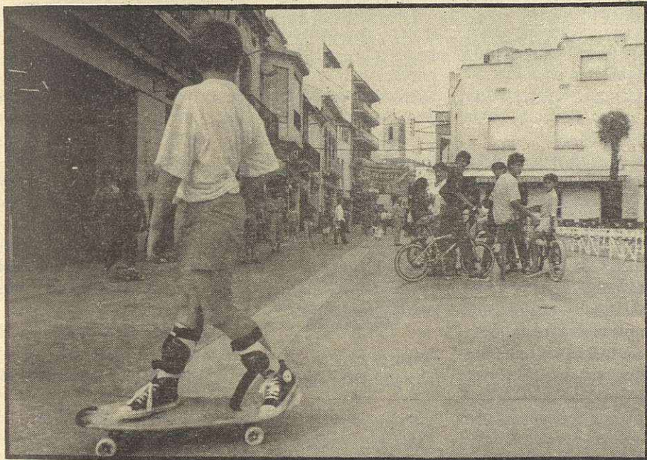
Ès bonic, però pot fer mal. La solució és construir una pista a la plaça Pau Casals

Per tot això que hem dit, i per tantes altres coses que el lector sap, considerem que la Zona Centre de Mollet, no ha estat tractada amb l'atenció que es mereix el Centre Urbà d'un poble que ha esdevingut ciutat.