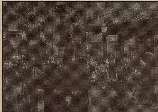
Els gegants moros, any 1949

El 1934 els gegants ja van sortir el primer dia de festa, el dimecres a la nit. Tal com diu Paco Cruz a La Festa Major. Granollers, 1957- 1993 , aquell 22 d'agost la comissió de festes havia suggerit la compra de gegants i nans, i que fossin de propietat municipal.