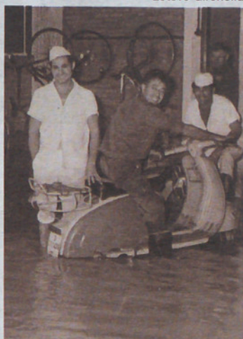
Fotografia de 1971.