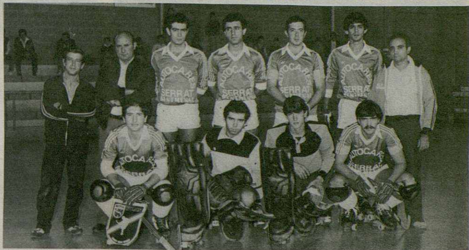
A.C.D. SENTMENAT Temp 82-83

—Puedo decir que en la presente temporada hemos enjugado ya más de la mitad y