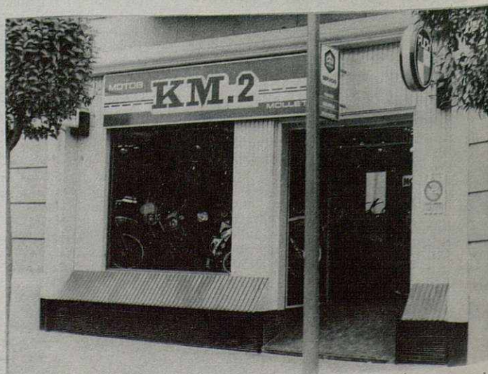
Vista exterior del establecimiento, enclavado en la Av. Llibertat, 35 de MOLLET DEL VALLES.