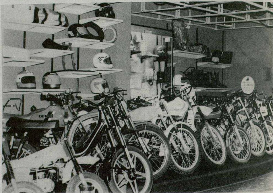
En la amplia exposición de MOTOS KM.2 pueden encontrarse los mejores modelos y las más acreditadas marcas, tanto en motos como en bicicletas.