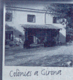
Colònies a Girona