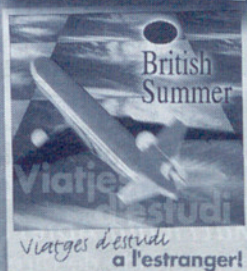
Viatges d'estudi a l'estranger!