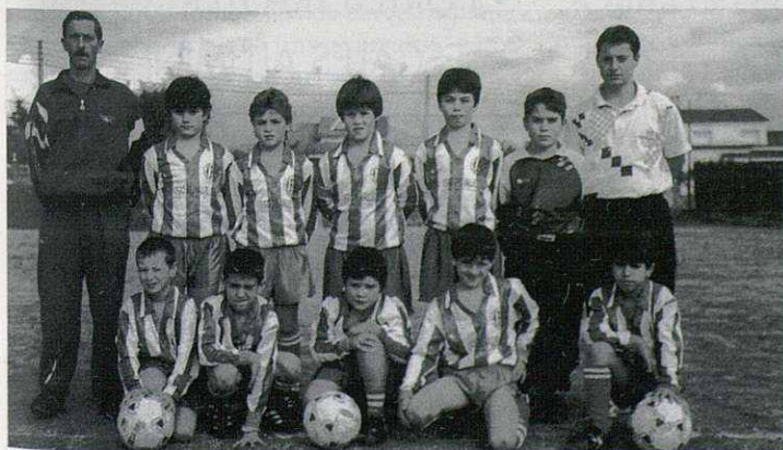
Equipo benjamín C.E. Sta. Eulàlia

En benjamines participaron l'Ametlla, Llerona y el Sta. Eulàlia A y B. En semifinales, el Sta. Eulàlia A se impuso al B por dos goles a cero. En esta categoría todavía no hay competiciones de liga, por lo que los equipos disputan los campeonatos comarca-