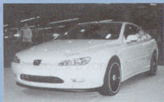
Muestra de Tuning

La previsión es que la fiebre del tuning nos deleite con vehículos cada vez más evolucionados para disfrute de los numerosos aficionados.