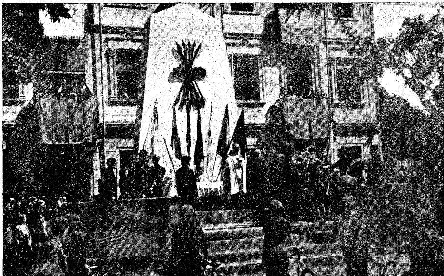
Momento de la bendición de las banderas en la concentración comarcal del 7 de Mayo de 1939

Y es que no hay memoria en los anales de la ciudad, de