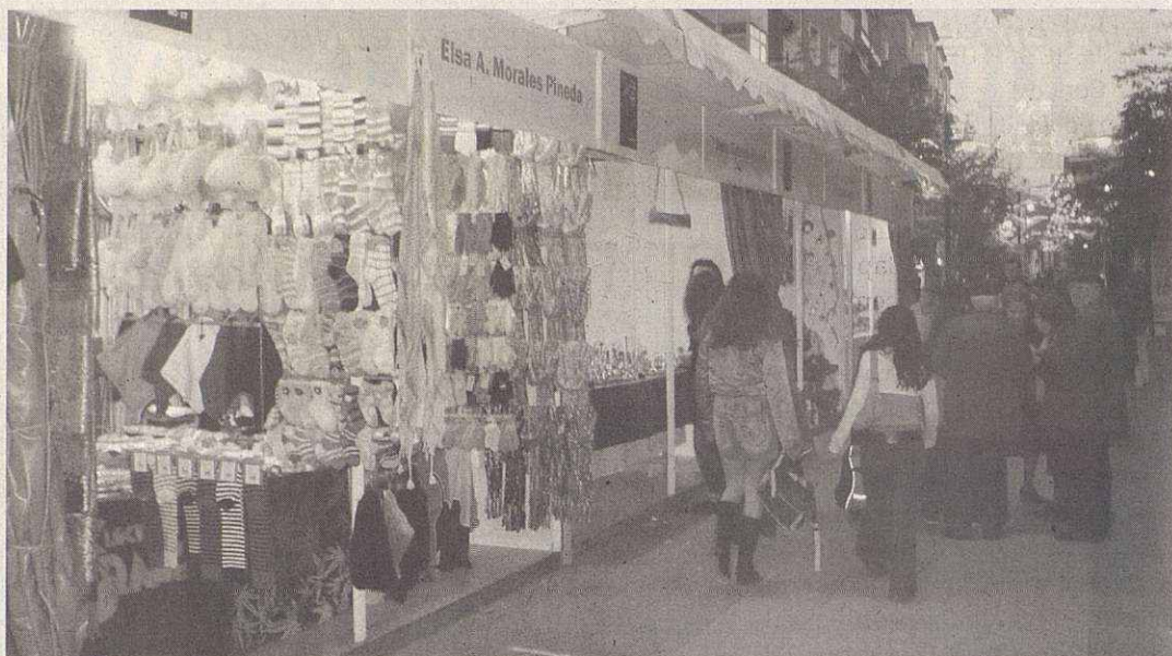
La tradicional Fira de Santa Llúcia torna a ocupar la Rambla Nova

→ serà present als carrers Jaume I, Rafael Casanovas, Berenguer III, Ramon Casas, Barcelona, Gaietà Víncia, Gaietà Ventalló, Rambla Nova, carrers adjacents, i al Mercat Municipal.