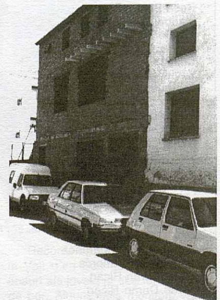
Obres del local de l'esplai..

sacrifici. No obstant si ens centrem en les activitats del curs, haig de dir que ens financem amb les campanyes econòmiques que portem a terme: venda de samarretes, venda de fanalets per la diada dels Reis, panera de Nadal, venda d'objectes fets pels nens, aportacions dels pares amb les quotes anuals, quotes per pagar les colònies i les sortides, i les subvencions de l'Ajuntament i el Moviment de Centres d'Esplai Cristians. La tómbola de la Festa Major ens proporciona diners per anar