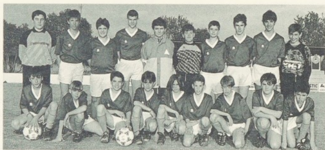
Aquí la tenim amb els seus "nens".

Els "seus" nens estan contents. Ha format un "equip" en tots els sentits de la paraula, ja que el futbol no és solament un esport per treure'ns dels problemes diaris, sinó que comporta que com a persones tinguem unes vivències molt interessants.