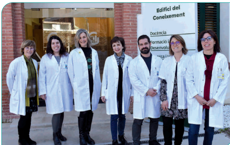
Equip de professionals de l'àrea de Recerca i Innovació

Dins del marc de l'àrea de Recerca i Innovació s'hi engloben les comissions i els comitès següents: comitè d'Ètica d'Investigació, comitè de Recerca, comitè d'innovació i comissió de Biblioteca.