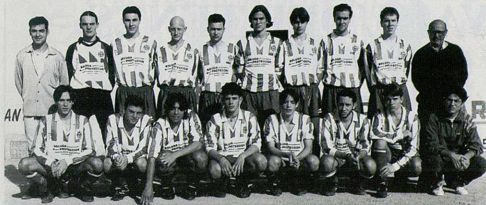
Juvenil “A” C.E. Sta. Eulàlia